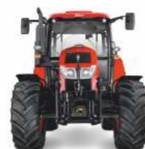
■ Forterra HSX 100 – 140 KM