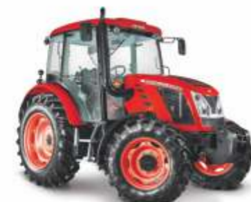
■ Proxima 80 – 100 KM