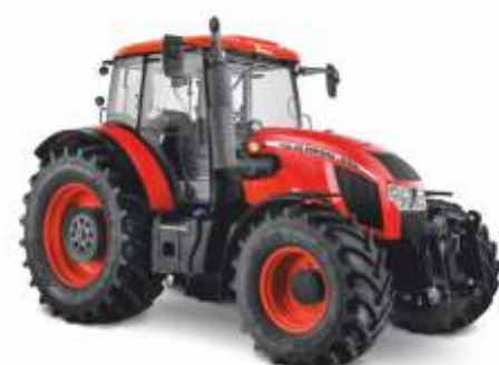
■ Forterra HD 130 -150 KM