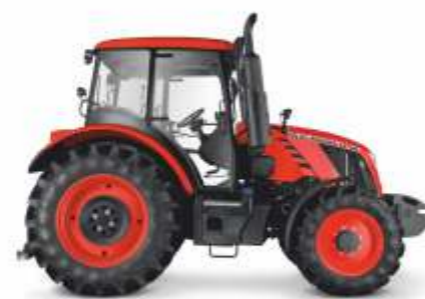
■ Proxima Power 80 – 120 KM