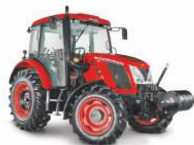
■ Proxima Plus 80-110 KM