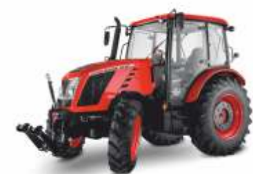
■ Major 60-80 KM

Prasy stało i zmiennokomorowe, prasy kostkujące, owijarki bel od stacjonarnych po samo załadowcze, szeroka gama rozrzutników nawozu i wapna, wozy asenizacyjne, rozsiewacze nawozów.