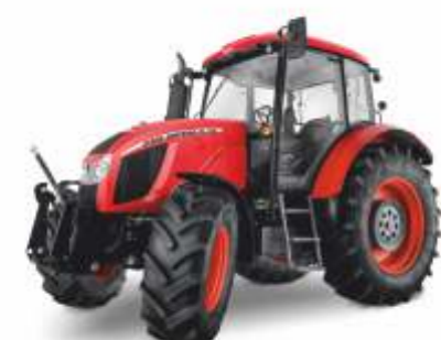
■ Forterra 100-140 KM