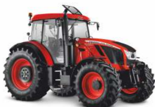
■ Crystal 150 – 160 KM